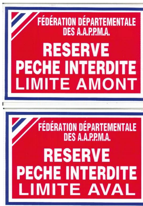
Figure 2 : panneaux d'interdiction